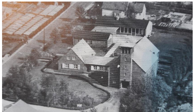
Gemeindezentrum vor der Erweiterung

21.9.1970: Konsekrierung des neuen Altares Erstmalige Wahlen zum Pfarrgemeinderat